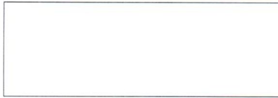
Схема границы балансовой принадлежности тепловых сетей

Прочие сведения по установлению границ раздела балансовой принадлежности тепловых сетей _____